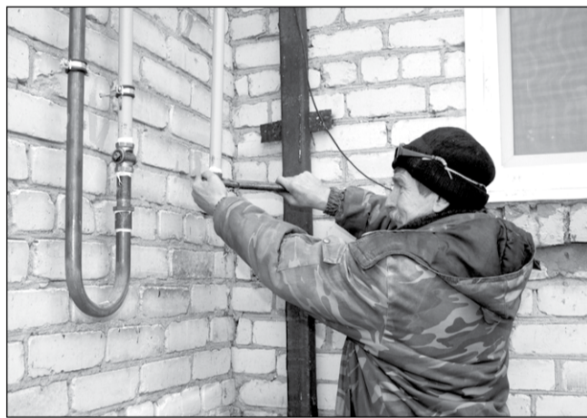
» Бригада ЗАО «СтройМонтаж» завершает газификацию трёх двухэтажных домов в посёлке Большевик

важно, чтобы в квартире было тепло. Теперь мы будем сами регулировать, больше нам включать или меньше. Даже летом похолодает, так мы не будем мерзнуть, а подключим котел, и дома станет теплее.