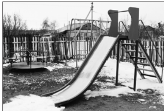
Детская площадка в селе Городище