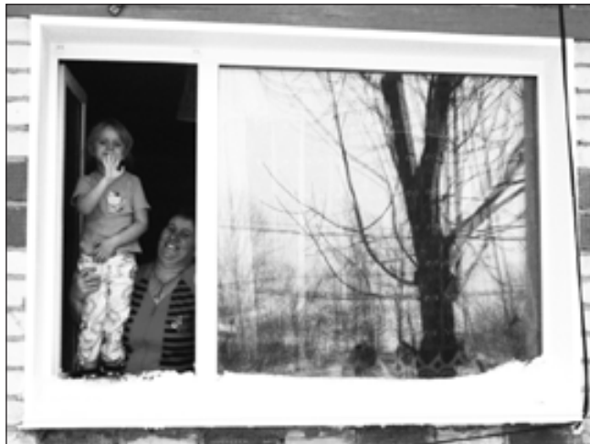
В короткие сроки новые окна украсили дом Воровщических

— У нас есть педагоги, есть дети, проблема — в нехватке инструментов для оркестра. Большую помощь, конечно, нам оказывают родители, особенно на отделении хореографии. Пошив костюмов для каждой постановки — это пожертвования родителей, помощь спонсоров. На других отделениях инструменты также постепенно обновляются. В школу были приобретены скрипки, фортепиано, клавишин. На самом деле инструменты, тем более концертные, очень дорогостоящие, изготавливаются под заказ. Нам бы хотелось приобрести для школы детский концертный баян, — так прокомментировала свою просьбу директор школы.