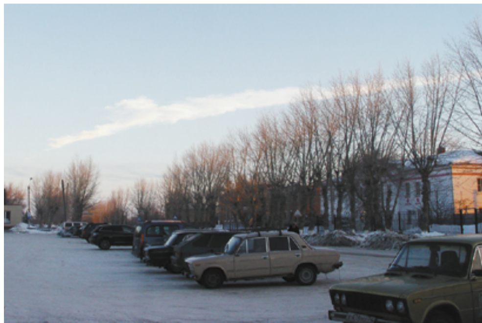
Вот такой дымовой след оставили осколки болида пролетая над Варненским районом

В настоящий момент все найденные частицы метеорита, а их больше десятка, описываются и систематизируются. Как рассказывал «Российской газете» член комитета РАН по метеоритам Виктор Гроховский, новые фрагменты метеорита были найдены южнее